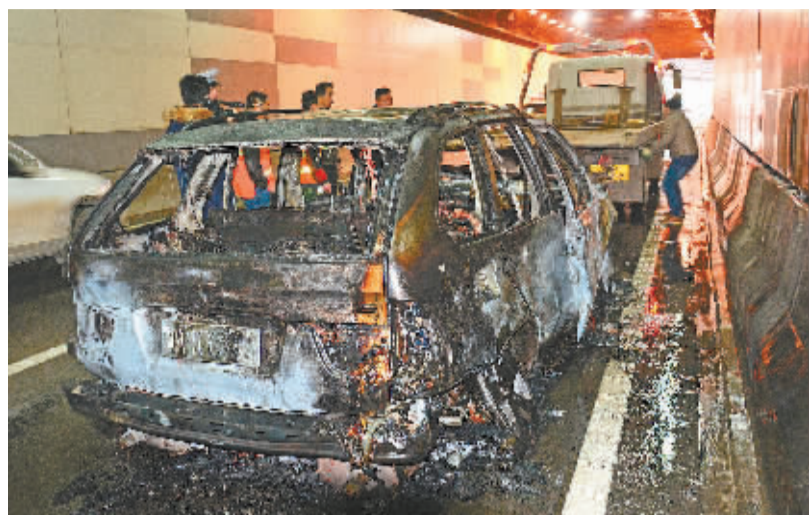
拖车准备将烧毁的越野车拖走

民警到达现场后,第一时间对进入水果湖隧道的车辆实施临时管制,车辆分流至东湖路辅道,同时民警进入隧道内依次指挥遇阻车辆调头离开隧道,为消防车进入腾出空间。武汉消防徐东、八一路、水果湖中队12辆车赶往处置,