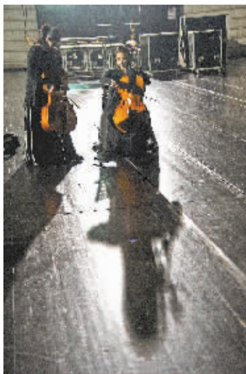
上场前,抓紧时间排练

合唱团的加入则让整场音乐会热闹非凡,《Adiemus》(拉丁文,意为“我们将靠近”)和《Can you hear me?(你听得见吗?)》两首外文歌曲,由童声合唱演绎出来显得十分特别。