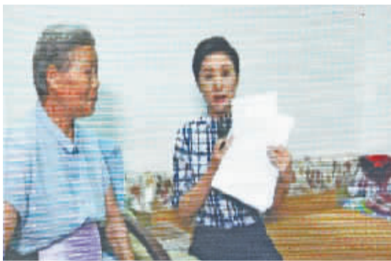
一堆材料证明“我是我儿妈”

想享受居家养老政策，75岁老人为“系独居”3个字跑了20多趟。昨晚，2017年上半年电视问政“期中考”第一场现场显示，基层暴露“新衙门作风”问题，基层群干没有落实“马上办、网上办、一次办”承诺。