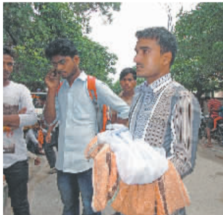
夭折儿童的家属站在医院外