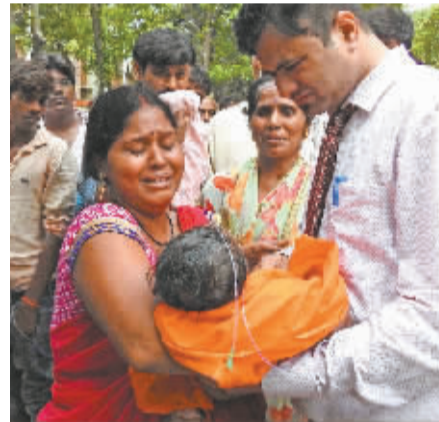
夭折儿童的父母悲痛不已