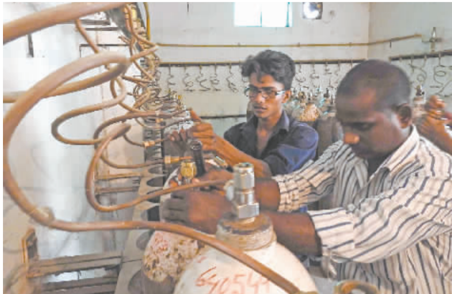
8月12日，工作人员在医院里检查氧气瓶

据印度电视台报道，该医院拖欠供氧机构欠款超过700万卢比（约合人民币72万元）。消息人士称，此前，院方领导已收到数封催款通知单。