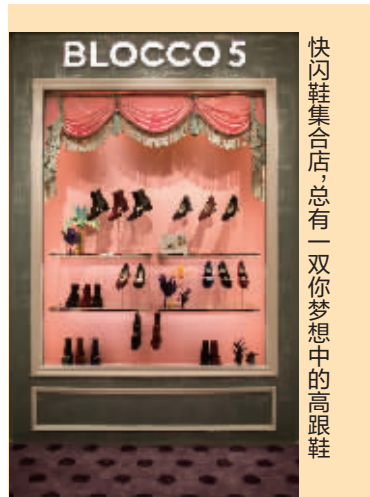
快闪鞋集合店,总有一双你梦想中的高跟鞋

用琥珀制作的首饰非常轻盈,由于材质密度低,真琥珀比塑料更轻,但太软太脆使用佩戴琥珀饰品的时候一定要小心,销售人员告诉记者这算得上是最优雅的首饰了,轻拿轻放,而且熔点低怕高温。由于轻盈,琥珀造型多变,可复古典雅,可夸张前卫。入门级的琥珀饰品在1500元到5000元人民币之间,而高档的收藏级别一个琥珀镯子从30万元到50万元不等,今年顶级的琥珀镯子出价高达150万元。