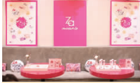
原宿可爱风的彩妆快闪店

日前,Za Hello Café主题快闪店亮相武汉天地壹方的一家花店里,在为期两天的活动中,Za将美妆与鲜花、甜品、咖啡相结合,为体验者们带来了一场奇妙的快闪之旅。此次主题快闪的活动是将品牌近期推出的焕白气垫修颜霜、新能真皙美白两用粉饼、心思蜡笔唇膏和控油防晒妆前乳4款新品分别对应咖啡店中的饮品所做的一次跨界结合。