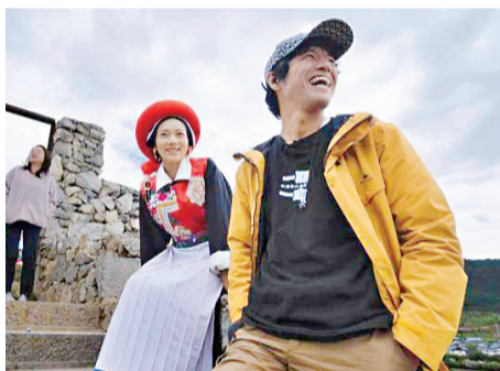
导演竹内亮和藏族女主人公茨姆。

日本有稳定的收入，有自己的房子，也有了孩子。来中国是要从零开始的，带着很大的风险。我用了两年的时间，说服老婆，迁居到了中国：一方面是想拍更好的纪录片；另一方面也是想挑战自己——因为当时还年轻，想着换一个环境会有新的挑战。”