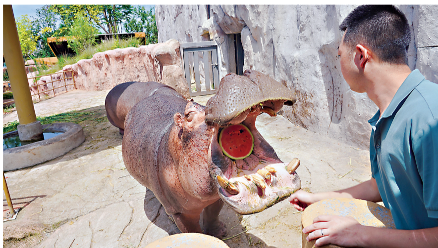
△保育员给河马投喂大西瓜。

正值三伏天，武汉动物园开启了花式度夏模式，不仅为园内的动物们提供各种清凉选择，还为入园游客提供凉爽降温体验。