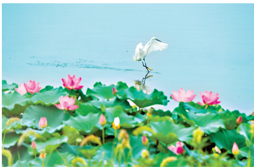
东湖国际摄影大赛中的荷花摄影作品:飞鸟戏水荷花边。

提起武汉的夏天,怎能少得了“赏荷”这一度假方式?23日,记者漫游东湖风景区,亭亭玉立的荷花绽放在东湖听涛景区、磨山景区、落雁景