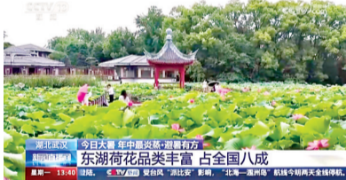
央视新闻直播间推出全国赏荷地图,武汉东湖位列其中。直播截图

暑气正浓,荷花盛放,22日央视新闻直播间推出全国赏荷地图,武汉东湖位列其中。23日记者踏访东湖风景区,邂逅在此盛放的1100余种荷花。