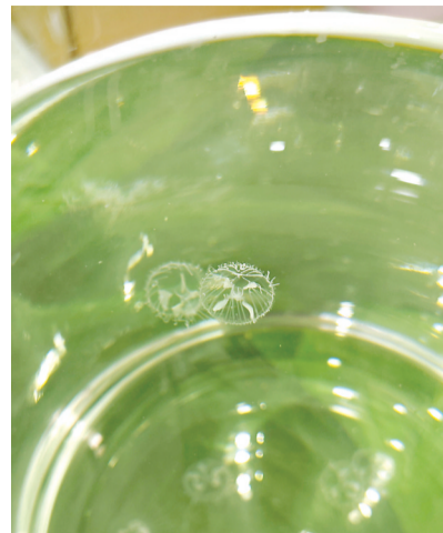
此次发现的宜昌桃花水母。

据介绍,除此次在东西湖区发现的宜昌桃花水母外,河南洛阳、四川眉山、福建漳州、江西南昌、湖北十堰等国内多地也曾发现桃花水母踪迹。该专家表示,我国桃花水母种类多、分布