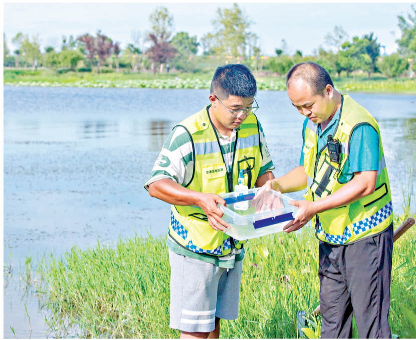
工作人员在湿地湖边采样。