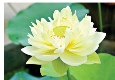
武汉东湖中国荷花品种资源圃新引进荷花品种“金翠牡丹”。

东湖磨山景区南门大堰荷塘区域,“东湖新红”绽放正艳,游客在荷塘中的栈桥、凉亭踱步赏荷,拍照打卡。“‘东湖新红’荷花品种比较高、