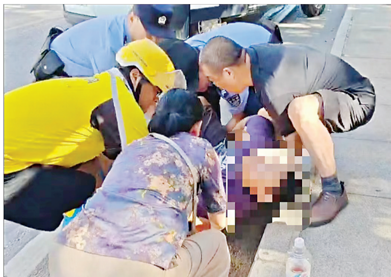
众人在路边抬起中暑男子的画面。