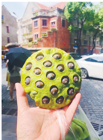
黎黄陂路上，买个老莲蓬，拍个照。

9月16日，记者来到武汉昙华林历史文化街区。一路上人头攒动，不少人举着相机拍照。沿街的手工作坊、文创商店里的特色文创产品，墙上精美的艺术装置，让许多年轻游客流连忘返。昙华林汇集的文化气息，让不少游客感受到古城的美好。陶艺店里，游客选择自己动手打磨一件作品；咖啡店里，尝一