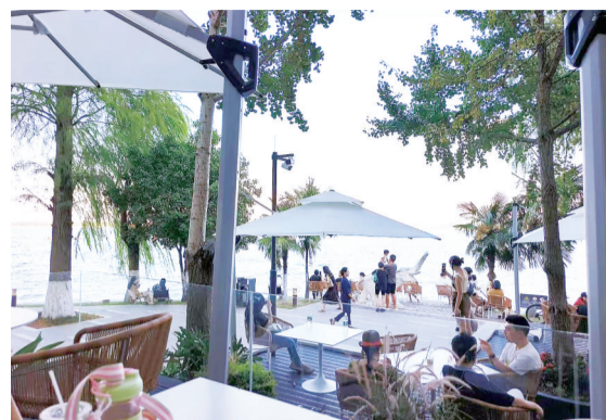
在一座临湖餐厅吃早午餐、喝下午茶。