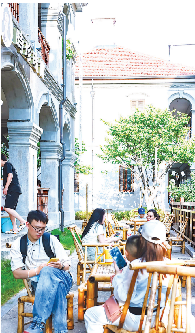
△在昙华林走累了，喝个中药茶饮。