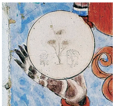
菩萨手中的月亮(特写)

金桂飘香，明月皎皎，又是一年中秋时。从古至今，中秋一直是中国人赏月思亲、阖家团圆的传统节日。遥望同一轮圆月，不禁令人好奇，古人如何过中秋？在世界文化遗产敦煌莫高窟，沉睡千年的壁画为我们勾勒出古人的中秋“仪式感”。