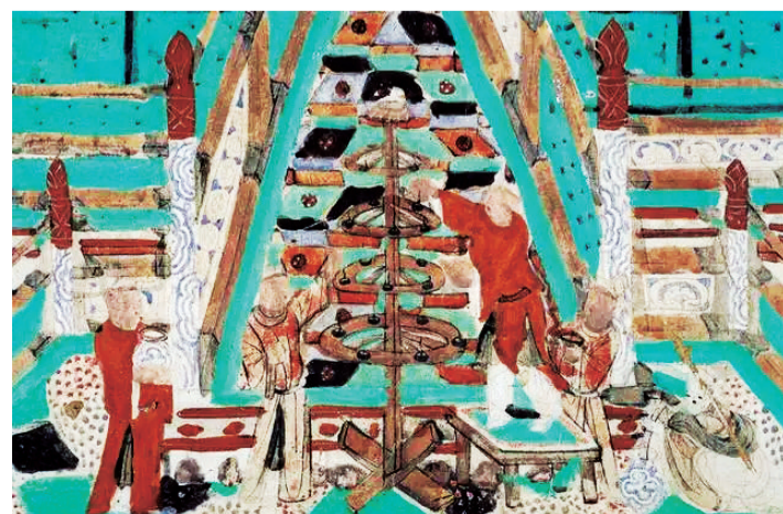
④莫高窟第146窟-药师经变之燃灯-五代