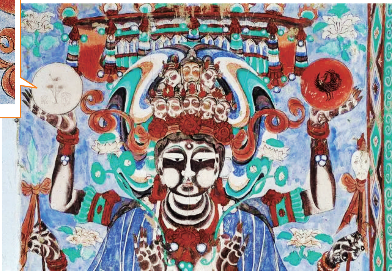
①莫高窟第35窟-手托日月的十一面观音菩萨-五代