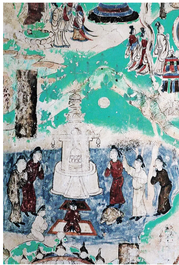
③莫高窟第103窟-佛顶尊胜陀罗尼经变之拜塔-盛唐