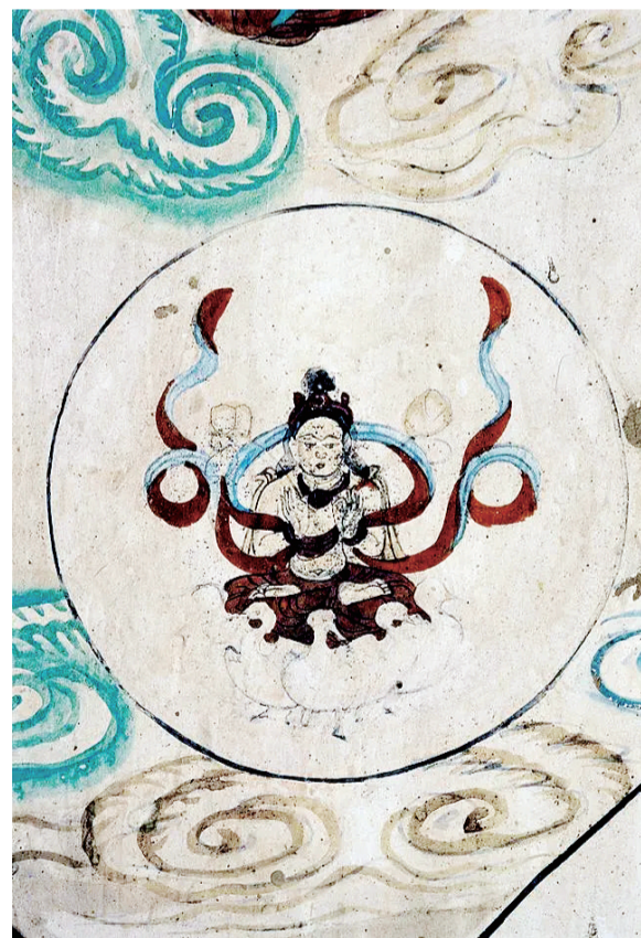
②莫高窟第384窟-月光菩萨-中唐