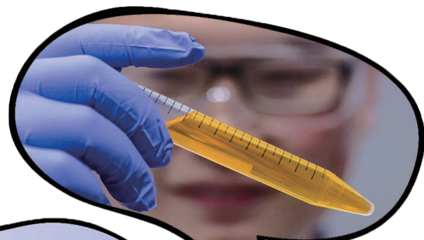
△研究的第一作者手持一管柠檬黄溶液。