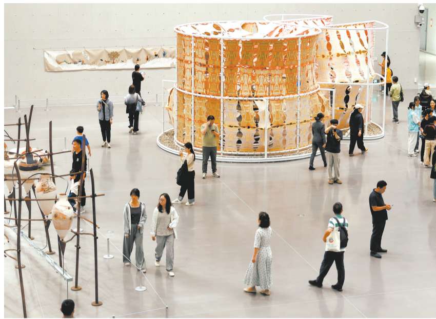
观众在武汉美术馆（琴台馆）参观。

当代艺术跨越传统学科边界和固有形态的融合创新，使艺术语言以自身的流动性呈现出表达的多样性。此次