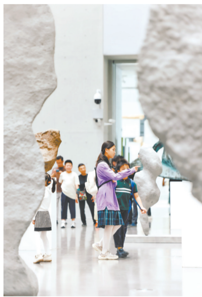
观众穿梭在雕塑作品《启示》的“石头阵”之间。