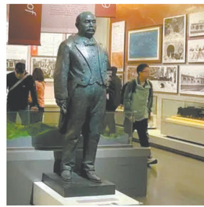
10月6日，游客参观中国铁道博物馆正阳门展馆。