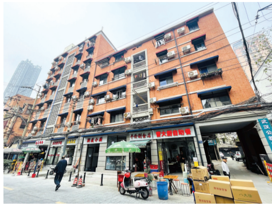
老房子改造后简洁大气。

洞庭街17号是一栋私人住宅,楼房不高有4层,门口挂着“武汉优秀历史建筑”的牌子。该建筑为一处石库门里份式住宅,红瓦屋顶,外墙红色清水砖和简约的水泥线条造型简洁大气,入口的石阶、木质百