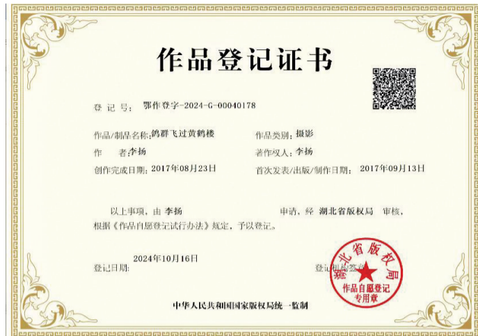
李先生获得的登记证书。

报、审查,他于10月16日正式获得了加盖“湖北省版权局作品自愿登记专用章”的登记证书。这次登记,他为这张照片正式命名《鸽群飞过黄鹤楼》。