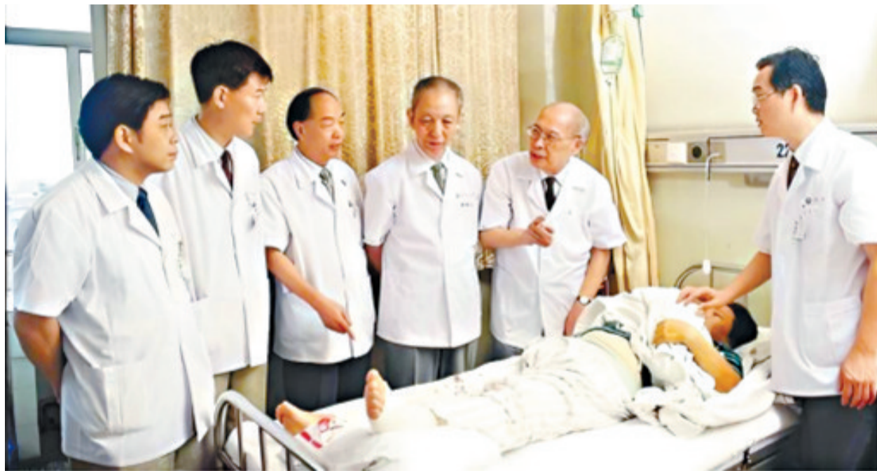
2002年,裘法祖院士(左五)、吴在德教授(左四)、陈孝平院士(右一)齐聚在同济医院病房查房。

据陈院士回忆,这位患者在单位体检中查出肝癌,于是在当地医院做了切除手术。三个月后,一直在家养病的他感到肝部疼痛突然加剧,还不慎摔了腿,家人将他送到同济。经化验大便带血,甲胎蛋白超过正常人的500倍,磁共振检查肝部复发肿瘤约有2.5厘米。由于患者已动过一次手术,身体还没有恢复过来,不宜进行第