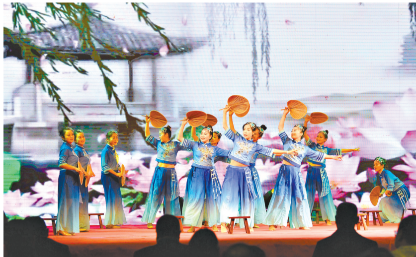
蔡甸街道跃进社区文艺队表演舞蹈《家乡的莲藕汤》。

小区大树下建起红心亭，法治宣传、纠纷调解等居民事居民议。通过搭建红房子、红心亭、党群驿站、社区百姓大舞台等，组建互助组织和兴趣