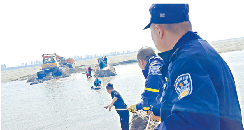
大家利用冲锋舟把群众救上岸。