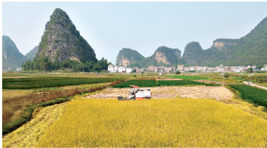
11月2日,在广西贺州市平桂区鹅塘镇栗木村,农机手驾驶收割机收割稻谷(无人机照片)。

据央视报道 眼下,秋收、秋种加紧进行,同时秋粮收储工作也有序推进,确保收好粮、管好仓。