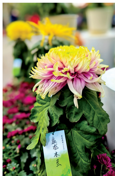
中山公园主会场展出的武汉“盘龙”系列菊花新品种。

活同频共振。武汉长江大桥通车、黄鹤楼公园重建开放、北京举办奥运会、神舟五号飞天……都成了金秋菊展的主题或题材。