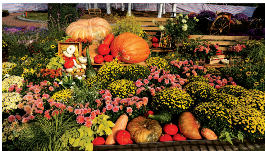
沙湖公园主会场丰收展区。

花卉的选用和布置丰富多彩、精益求精。现场很多盆菊花摆在一起很好看,把每一盆花单独拎出来看,也可成为一景,从整体到细节都很美。在营造