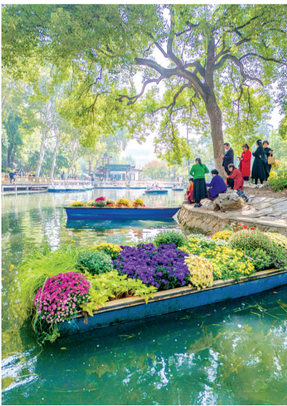
中山公园主会场湖面花船。