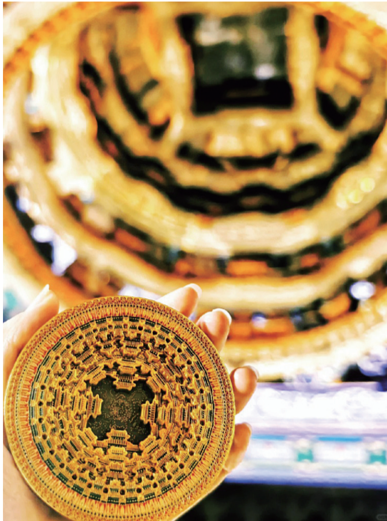
网友在社交平台展示天宫藻井冰箱贴。

北京古代建筑博物馆还有另一个重要的“镇馆之宝”——隆福寺毗卢殿蟠龙藻井。它由珍贵的金丝楠木独木精雕而成，井芯上的龙形象威严，呈向下俯冲姿势，体态生动。以它为原型的蟠龙藻井冰箱贴也是该博物馆热销文创产品之一。