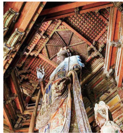
现存最早的木构藻井是蓟县独乐寺观音阁藻井。

要装饰内容，这是因为莲花是佛教净土的象征，素称“莲之出污泥而不染”。敦煌莫高窟现存492个洞窟，其中420个洞窟里都有藻井，而莲花图案一直延续了千余年之久。