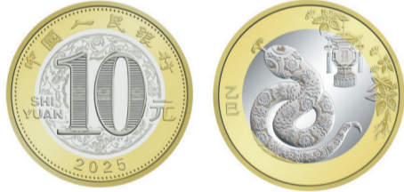
2025年贺岁双色铜合金纪念币。

双色铜合金纪念币背面图案为中国传统剪纸艺术与装饰年画元素相结合的蛇形象，衬以花灯和人参图案，币面左侧刊“乙巳”字样。纪念钞正面主景为蛇的造型图案。背面主景为儿童贴春联图案，辅以西民居装饰图案，上方为面额数字“20”、汉语拼音字母“YUAN”，下方为花卉与动感全息图案、年号“2025年”、行长章、面额数字“20”、“中国人民银行”汉语拼音和蒙、藏、维、壮四种民族文字的“中国人民银行贰拾圆”字样。