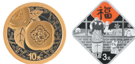
2025年贺岁金质纪念币和银质纪念币。