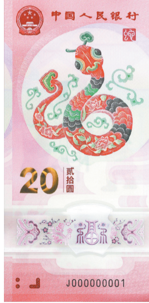
2025年贺岁纪念钞图案。