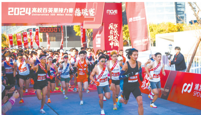
中国高校百英里接力赛总决赛8日在上海举行。