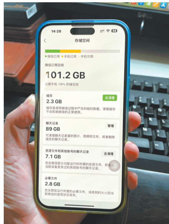
张女士的手机微信占用超过了100GB。

为保障微信的顺畅使用,有无办法让微信占用瘦身?一位资深人士给出了如下建议,来缓解存储空间焦虑: