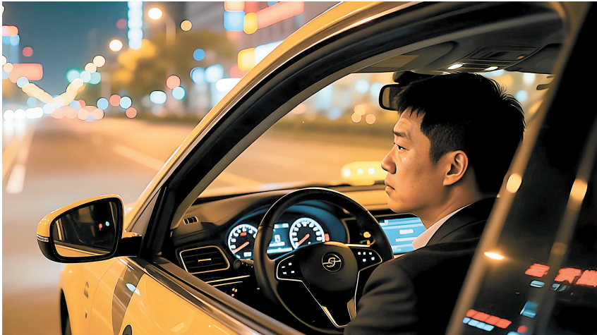
一些司机对“一口价”订单颇有微词。