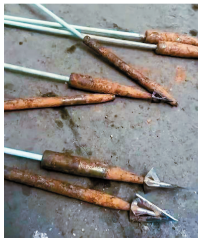
收缴的“无人机狩猎”箭头。