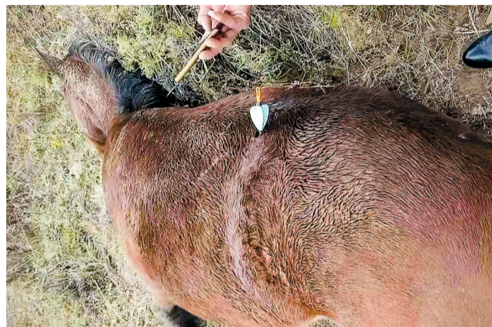
价值一万多元的马匹被无人机投放的利箭射杀。