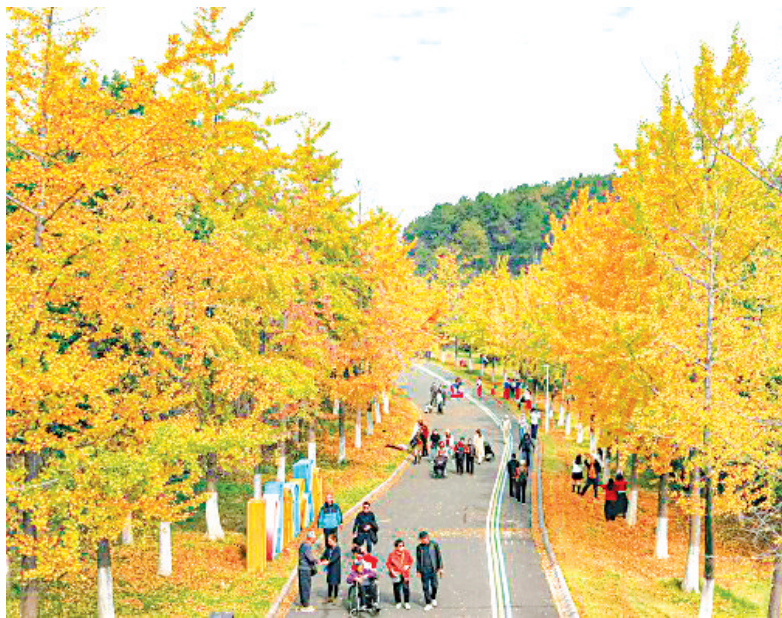
藏龙岛国家湿地公园银杏满眼金黄。

除银杏果的问题外,今年银杏的变黄节奏也引发讨论。不少市民注意到,武汉不同区域的“黄叶进度”差异明显:东湖高新区等地银杏已大面积金