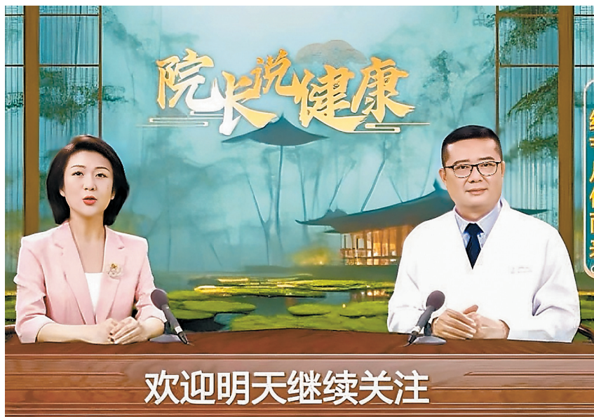
养生课的布景,看起来很像电视节目。

近日,中国消费者协会连发两条消费提示,呼吁老人理性购买保健食品,警惕“伪营养师”的推销。 记者调查发现,目前市面上有一些养生群会吸引老人加入,并精心编制“养生课”陷阱,看似是传授养生知识,实则伺机向老人推销各种药品和保健品。养生课的“主讲专家”往往拥有响亮的名头,但身份却经不起推敲。