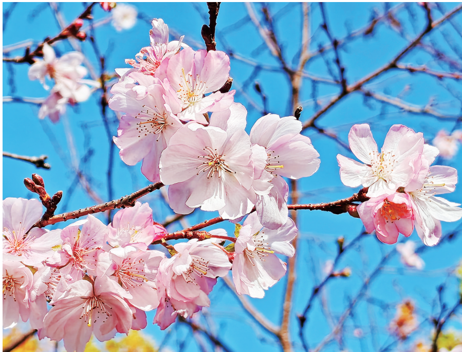
冬日怒放的奖章樱。