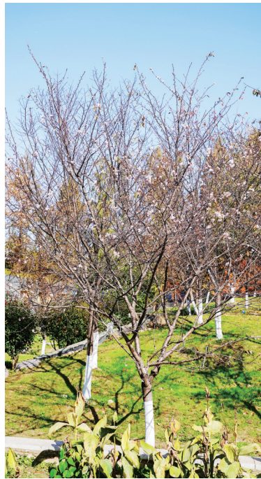
市园林科普公园樱花山盛 开的奖章樱。