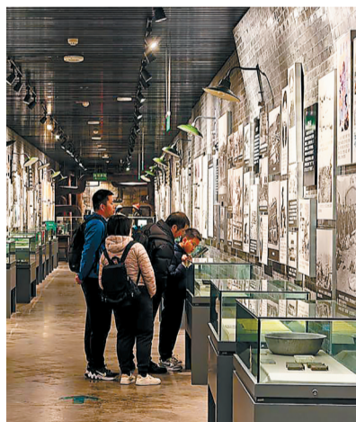
游客在重庆市九龙坡区的建川博物馆聚落参观。