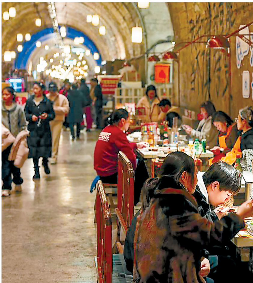
游客在重庆两江新区“地下之城”火锅店里用餐。

“虽然特别定制增加了投入,但此举有助于实现战备效益、社会效益和经济效益的统一,是现代人防工程建设的必要举措。”重庆警备区某局领导表示,城市更新提升了人民群众的生活品质,人防工程也应同步提档升级,为城市安全提供重要屏障。