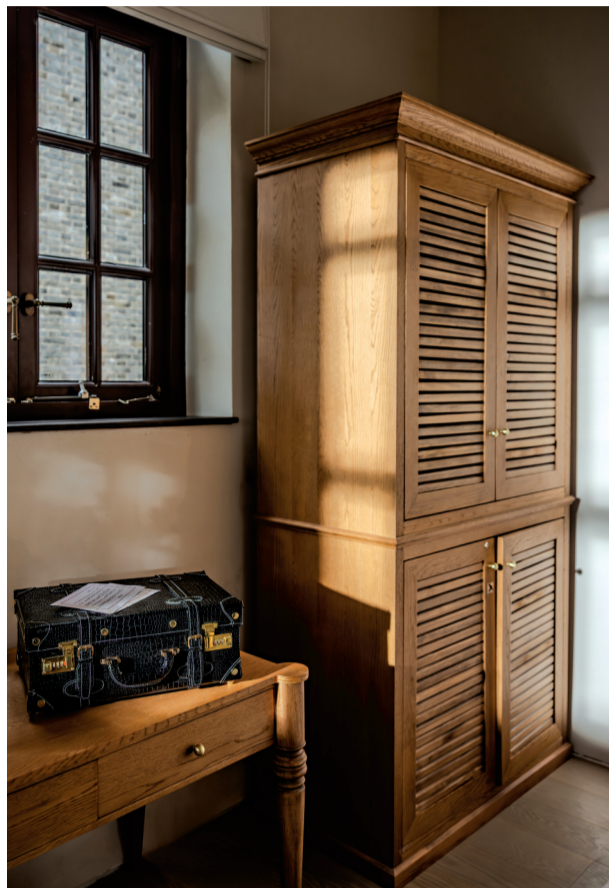
剧宿房内有密码箱等专属道具。

“剧宿房的沉浸式体验,从踏入剧宿房的这一刻就正式开启。”保元里·风舍艺术客栈负责人介绍,选择入住剧宿房的住客,入住时将拥有一个专属戏中身份,每个剧宿房里都藏着专属道具和隐藏机关。住客在工作人员的指引下化身《保元风云·前传》中的角色,通过与店内NPC互动,与同行伙伴协作解谜,一步步推进剧情发展。客栈内的密码