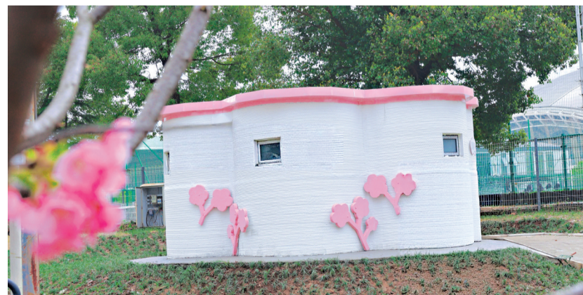
汉马赛道沿线仁和路新增两座樱花造型的3D打印公厕。

部设施已全部安装调试完毕,静待正式启用。这两座公厕均设有无性别厕位、无障碍洗手间和环卫工作间,充分满足全年龄段、全场景的使用需求,为赛事期间的