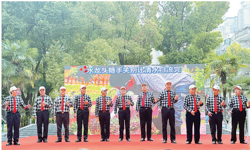
居民自编自演文艺节目宣传节水。

此次活动是华锦社区将低碳绿色生态与节水护水有机融合,以群众喜闻乐见的形式,丰富辖区居