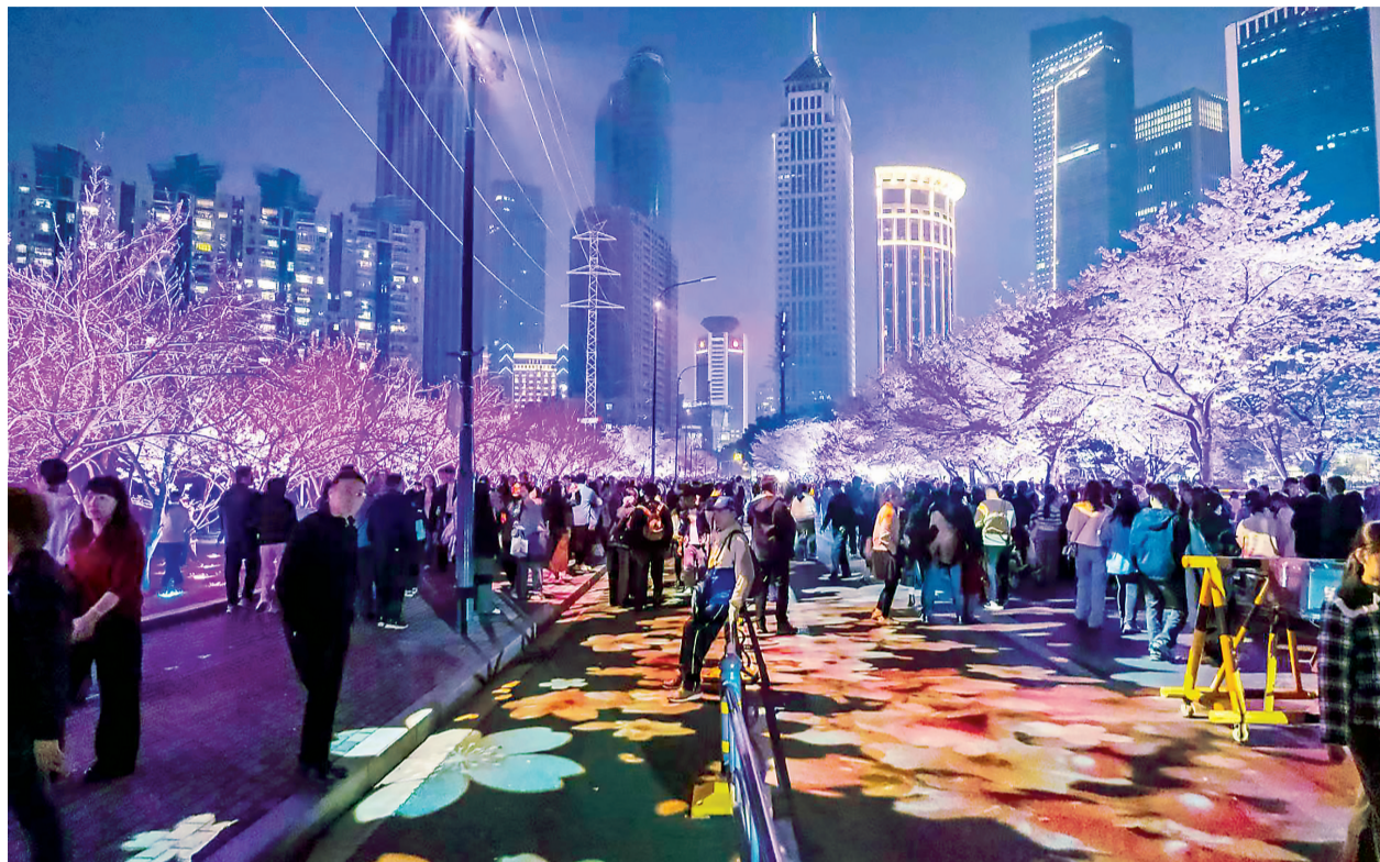
西北湖绿化广场400余株樱花迎来最佳观赏期。

据了解,此次临时交通管制时间为工作日19时至22时、周末11时至22时,驾车前来的游客可