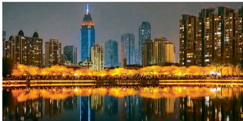
西北湖绿化广场迎来樱花最佳观赏期。

“限时步行街”的首次亮相,并非临时起意。今年,江汉区全面启动城市精细化管理三年行动,西北湖片区被列为重点打造的五个“样本片区”之一。樱花季期间,城管、交管、文旅、街道等多部门联动,将贴心服务延伸到花海一线。