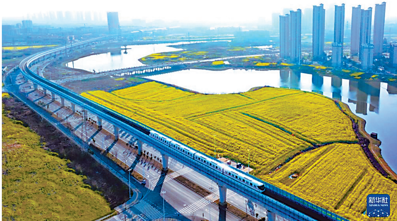
武汉地铁16号线穿越武汉经开区的油菜花海。