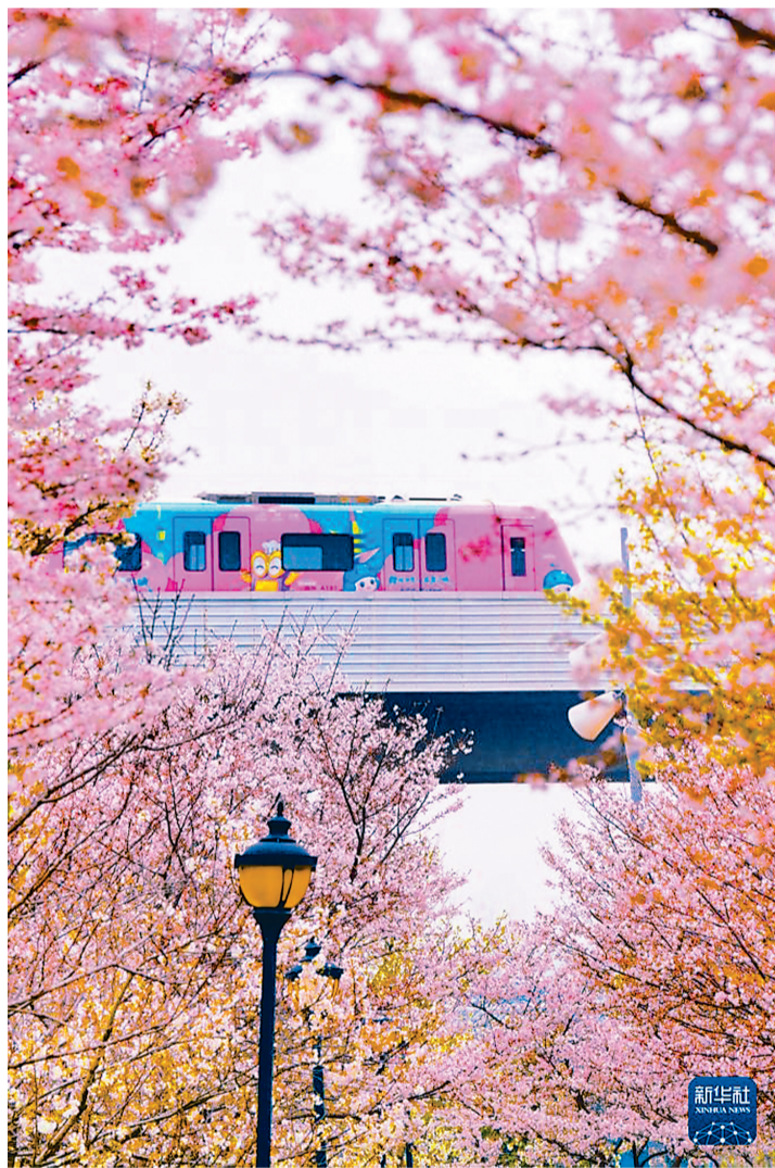
武汉地铁1号线樱花专列驶过樱花树林。

目前，武汉518公里地铁线网正串联起满城繁花。这座被春色浸润的江城，正以蓬勃生机迎接八方来客。