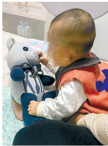
英雄爸爸生前卫衣改制的小熊。小女孩抱着“姥姥熊”。