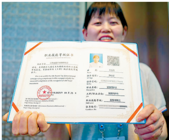
上海今年首场长期照护师职业技能等级考试现场。