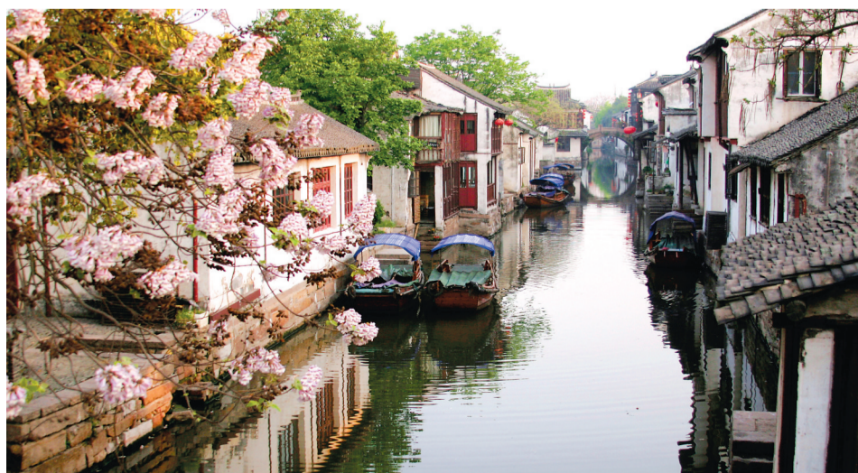
《花润水乡》 作者：吴永寿(65岁) 汉阳区龙阳街道汉城社区