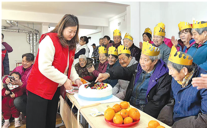
△居民在活动空间过生日。