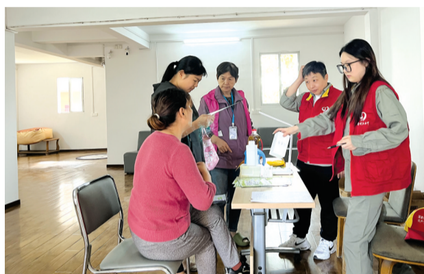
◁社区在活动空间宣传政策。