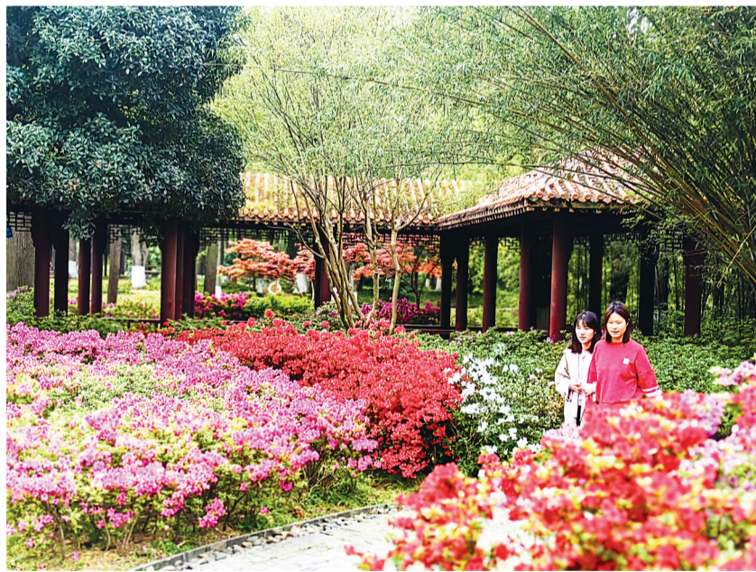
青山公园杜鹃园精品荟萃。