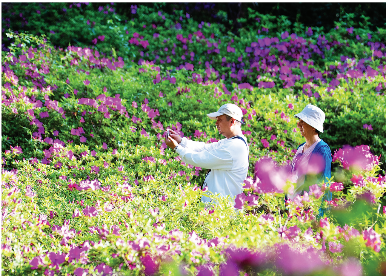
市民在青山公园欣赏杜鹃。

青山公园的杜鹃花，按颜色分为白色、红色、绿色、紫色等多个色系。红色系杜鹃中，红得最鲜艳的当数火烈鸟杜鹃，颜色酷似火烈鸟的羽毛。有一种白浪