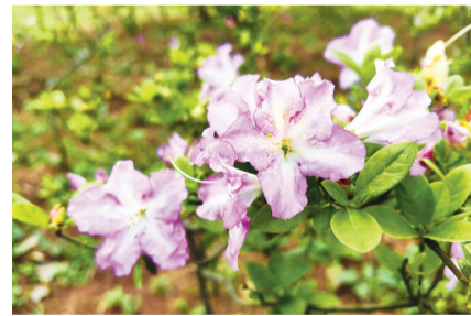
会变色的幻境杜鹃。