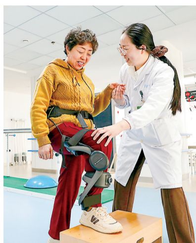
老年患者穿戴外骨骼机器人。