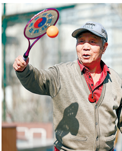
天津居民在口袋公园内锻炼。

15条防癌法则，覆盖生活方方面面，帮助公众从日常生活做起，成为自己健康的“第一责任人”，有效降低癌症发生风险。