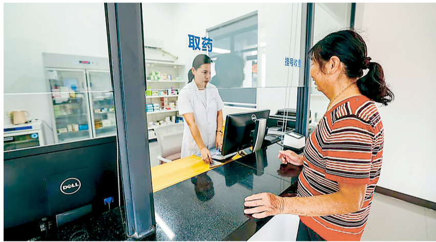
2025年9月23日，村民在金华市孝顺镇卫生室配药。

近日，国务院办公厅印发《关于健全药品价格形成机制的若干意见》(以下简称《意见》)，提出14条举措，强调充分发挥市场在资源配置中的决定性作用，更好发挥政府作用，优化创新药等新上市药品首发价格机制、发挥医保支付标准对药品价格形成的引导作用、引导药店合理制定药品零售价格、强化短缺药保供稳价，有效服务药品领域全国统一大市场建设，健全以市场为主导的药品价格形成机制，支持医药产业高质量发展，保障人民群众获得质优价宜药品。