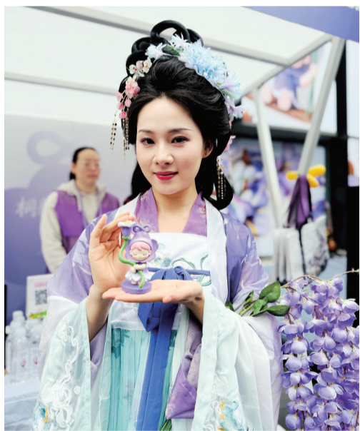
汉服小姐姐展示紫色“桐宝”娃娃。