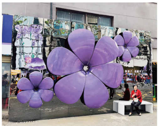
大朵紫色花饰吸引居民拍照。