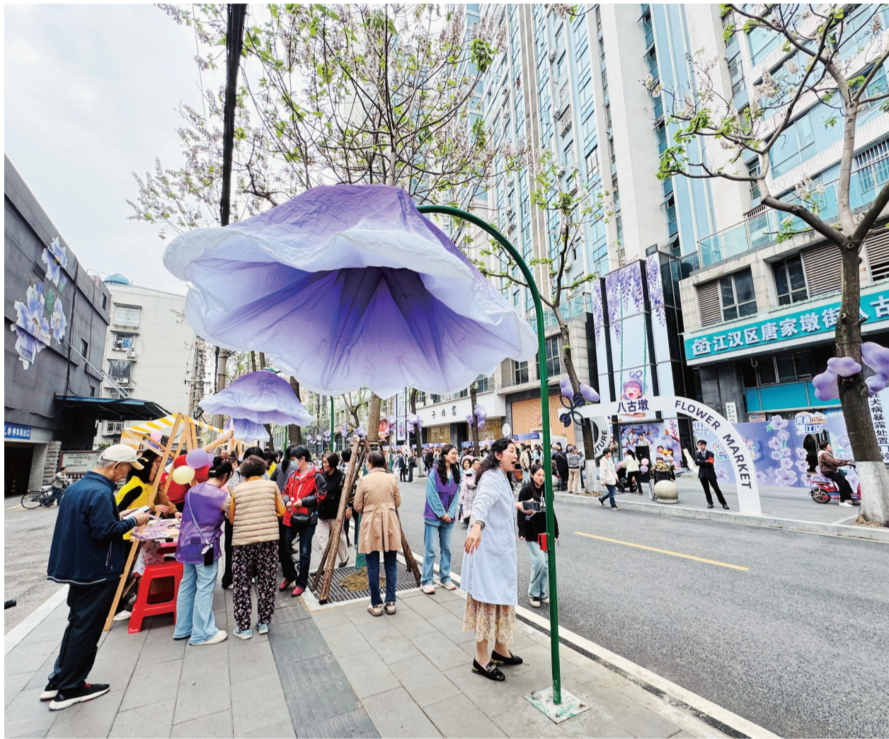
路边安装了紫色氛围灯。

江汉区城管执法局相关负责人表示,今年将持续推进八古墩片区的环境提升工程。通过改造升级八古墩东一巷、东三巷等街巷,完善基础设施,打造口袋公园、林荫步道和运动场地,实施铁路沿线绿化和墙面彩绘,补齐城市功能短板。同时,通过加强社区城管服务,有效解决乱停乱放、流动摊贩等城市管理难题。特别是在八古墩东一巷的改造中,不仅补栽了泡桐树,还打造了主题手绘墙,将这条老巷子变成了独具特色的泡桐花景观道。这一系列举措,不仅美化了环境,更为老社区注入了新的活力与发展机遇。