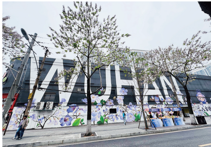
八古墩东一巷墙绘与泡桐花相映成趣。