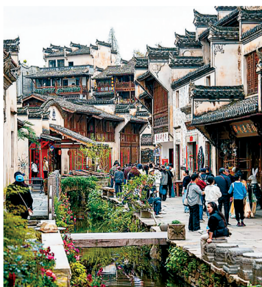
弦高城内游人如织。