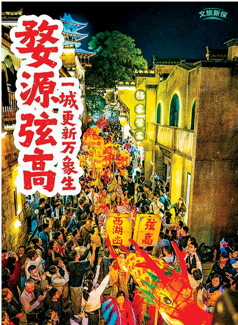
婺源弦高文旅街区游人如织，释放“春日经济”新活力。

数据印证着这份春日热度。清明期间，婺源县全县接待游客49.4万人次，同比增长68.6%，假期首日单日接待游客超12万人次。