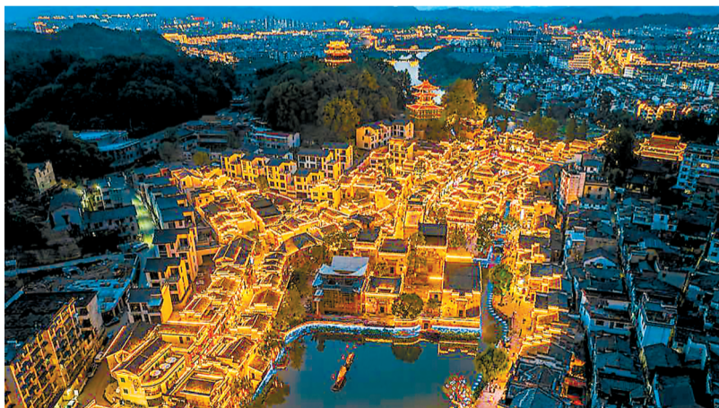
无人机视野下的弦高城夜景。