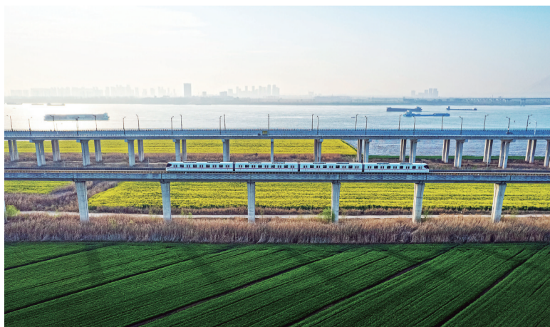
《生机盎然》 城市摄影队 马二虎 摄于武汉经开区