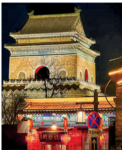
现在的钟鼓楼,夜晚灯光温润大气、层次分明。