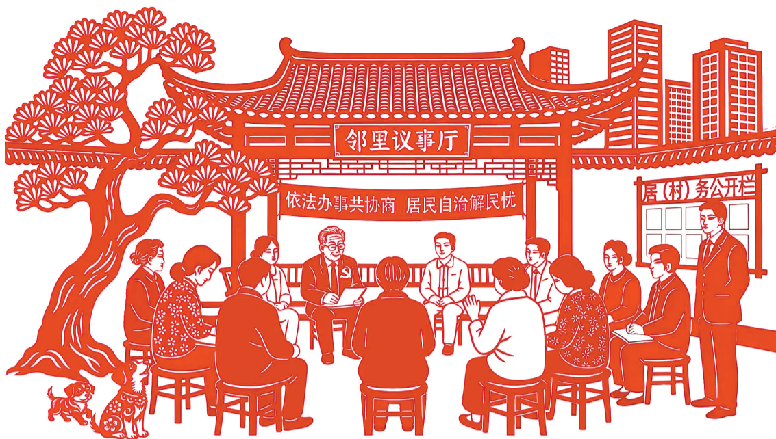
△ 《邻里议事厅》 作者:韩恒涛(29岁) 喻政森(24岁) 洪山区珞 南街道博苑社区