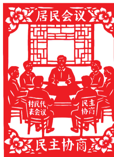
《居民会议》 非遗剪纸 作者:金俊安(39岁) 李丹丹(38岁) 洪山区珞南街道博苑社区