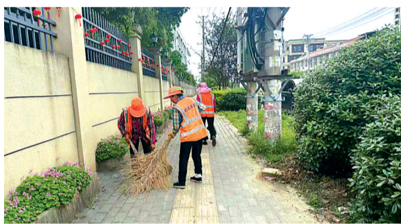
△环卫工作人员清理路面油污。