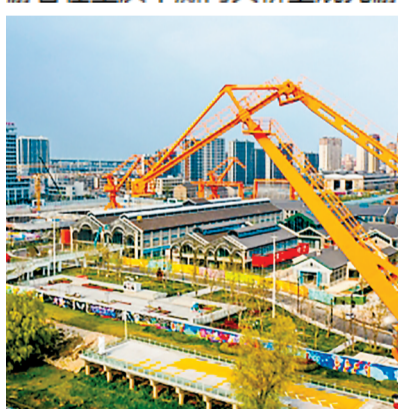
安徽芜湖“老船厂1900”项目。