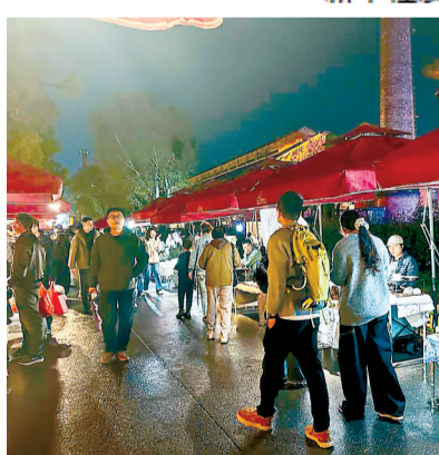
景德镇陶溪川文创街区市集。

乱建70余处，加固36栋楼房，将昔日臭水塘改造为景观塘，同时全面升级水、电、路及排污管网，新增800多个停车位。记者看到，遗存的砖拱水渠变身开放式小型演艺舞台，村间空地改造成为文化广场，原住民开办的民宿和店铺正在营业，不少新居民也入驻创业。不远处，第三期工程正在推进，将继续对破败的房屋和脏乱的小巷进行更新改造。