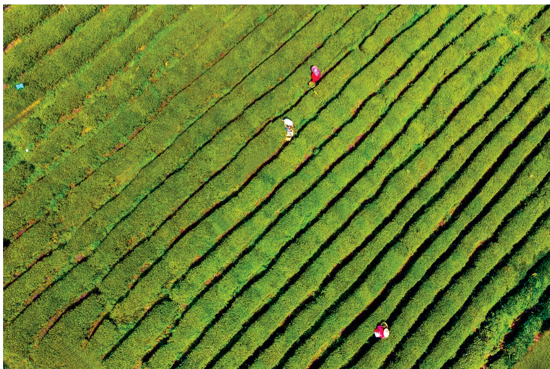
△ 《红岗山茶场》 作者:应文(54岁) 硚口区汉水桥街道汉水桥社区