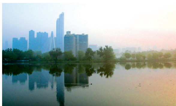
▷ 《晨雾湖影》 作者:喻晓安(69岁) 汉阳区晴川街道龙灯社区