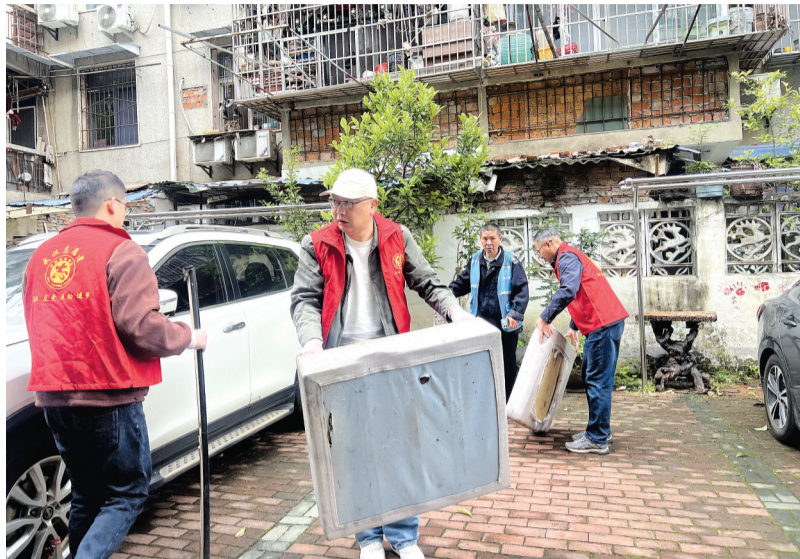
社区工作人员与共建单位人员齐心清理小区环境。

钻进楼道里，几个人合力把一张破旧的三人沙发从三楼抬下来。那沙发又重又脏，弹簧都露出来了，一碰就掉渣。可他们谁也没嫌脏，喊着号子一步一步往下挪。更让我意外的是，东西湖区审计局不仅出人，还专门调来了一辆垃圾清运车——要知道，以前我们这儿清理大件垃圾，最发愁的就是没有车，清出来了运不走。