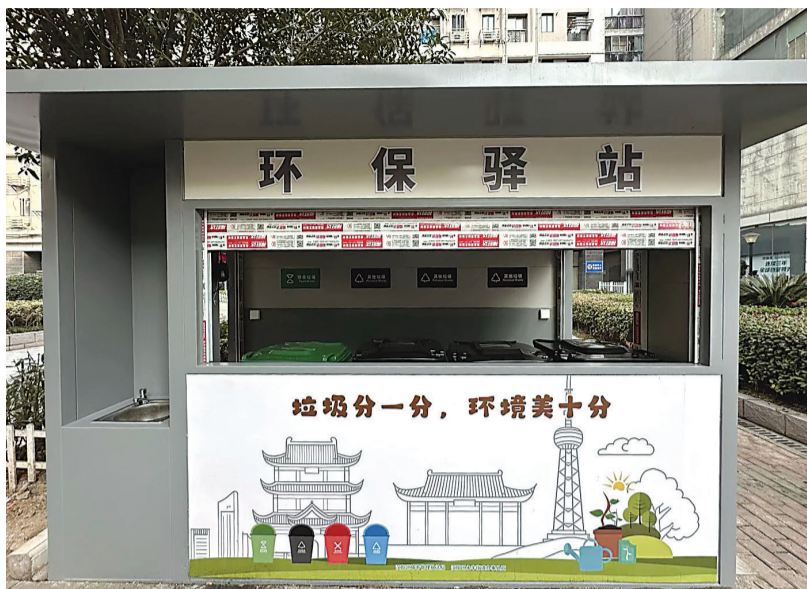
汉沙社区改造后的环保驿站。

开分类知识讲解会,一点点普及分类知识,还不断根据我们的建议优化方案。这么用心为我们着想,项目一推出就得到了大家的全力支持。