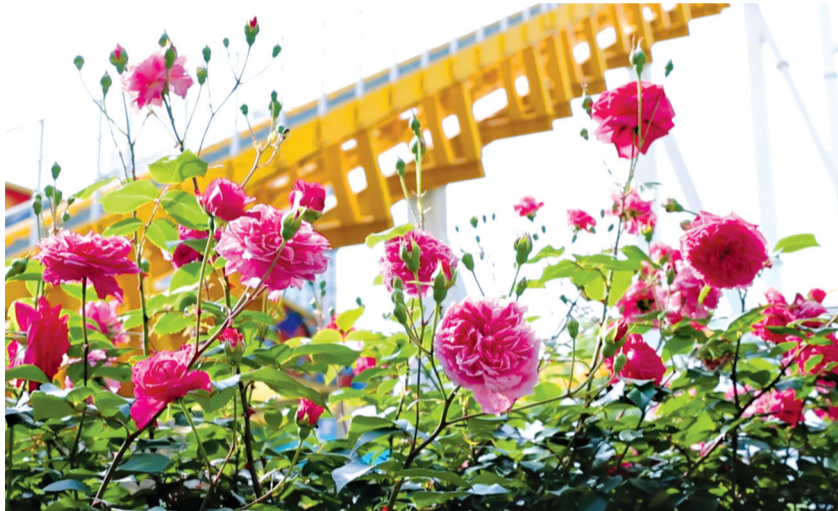
中山公园，蔷薇花正在盛放。

4月27日下午6时，记者在现场看见，位于沿江大道与芦沟桥路交会处，紧邻三峡集团大楼